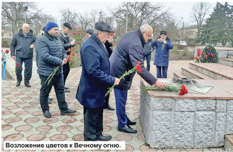
Возложение цветов к Вечному огню.